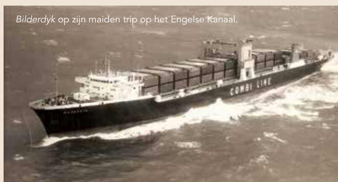
Bilderdyk op zijn maiden trip op het Engelse Kanaal.