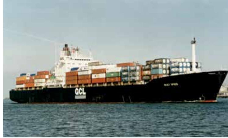
De Gulf Speed .

De kapitein was binnen enkele minuten boven en de Williams-turn manoeuvre verliep perfect. Het in nood verkerende bootje lag aan 't einde van de manoeuvre precies midscheeps. Sibrand was ondertussen met de bootsman en opgeroepen matroos bij de loodsdeur om de loodsladder gereed te maken. Toen de loodsdeur openstond, bleek het niet om een sportvissersbootje te gaan, maar om een 'oud' motorsloepje met aan boord vijf mannen en een jongen. Ze riepen in het Spaans om hulp en waren erg blij dat we waren gestopt. De aanwezige matroos was van Spaanse origine en kon direct vertalen wat er werd geroepen. Verder bleek de sloep voor bijna de helft gevuld te zijn met water. Dit werd naar de brug gemeld en de sloep werd vastgemaakt aan het schip. De kapitein beval om de drenkelingen voor de zekerheid bij het aan boord komen te fouilleren; zogezegd, zo gedaan. Eerst werd het jongetje aan boord genomen en de mannen bij aan boord komen gefouilleerd. Ze hadden een machete bij zich en een pistool. Deze zaken werden zonder weerstand afgegeven en de drenkelingen werden